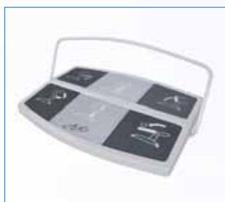
PPA-556 Bezdrátový nožní ovladač