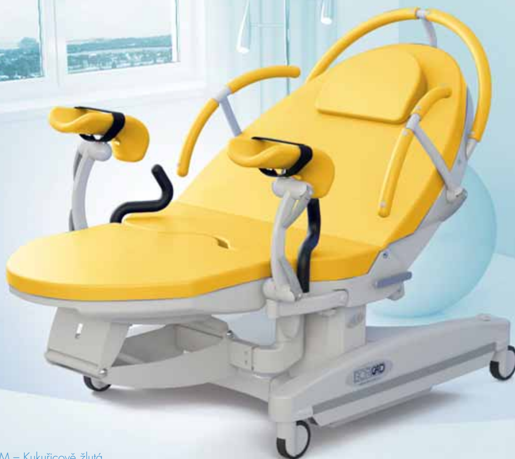
M – Kukuřicově žlutá