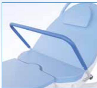
PPA-29-X Hrazda čalouněná s 2 fixačními klouby