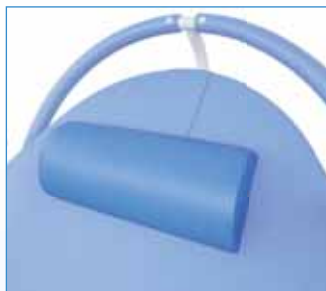
PPA-70-X Podhlavník půlkulatý