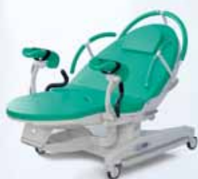
F – Oceánově zelená