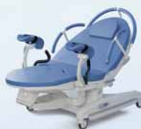
B – Brilantově modrá