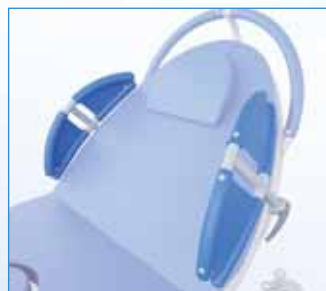
PPA-00.36-X Dvojitá boční zábrana s čalouněním – pár