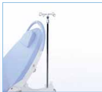
PPA-36 Stojan infuzní nerezový, teleskopický