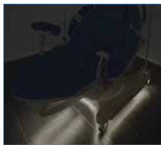
PPA-535 Podsvětlení postele