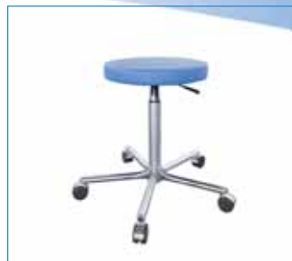
ZK-05.X Lékařská židlička