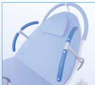
PPA-00.35-X Boční zábrana s čalouněním – pár