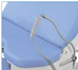
PPA-71 Držák ovládače