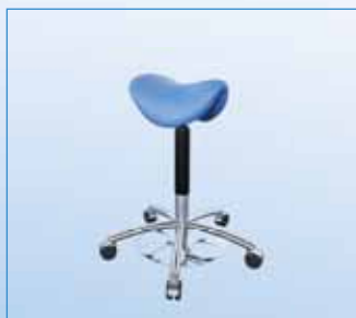
GKB-076 Lékař. ergonom. židle nastavitelná nohou