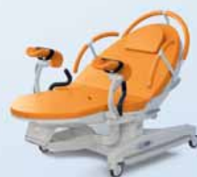
P – Oranžová