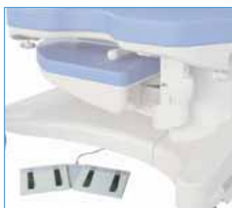
PPA-48.21 Nožní ovladač