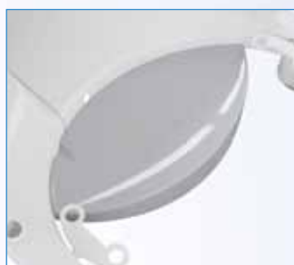
PPA-65 Miska odkládací plastová