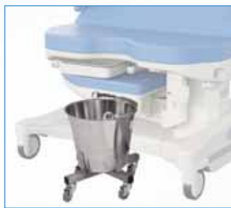
PPA-33 Miska velká, nerezová – 10 l