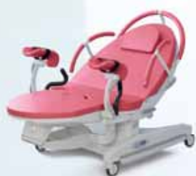
T – Růžová