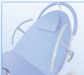
PPA-00.37 Boční zábrana bez čalounění – pár