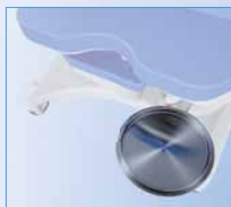
PPA-083 Miska instrumentální